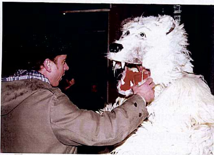
Edateko, ura; lastotxoarekin bada, hobe! 2004.

Hartza, ibilera baldar eta makaleko plantigradoa, bakarzalea da eta banaka edo talde txikietan ibiltzezalea. Esparru ezagunean mugitzea gustatzen zaio eta ez da erasotzailea, mehatxatua sentitzen ez bada behintzat. Gehienak orojaleak dira, baina landareak jaten dituzte batez ere. Negua lo sakonean murgilduta eman arren, negualdia etetzen dute beraien hartzatxoak ernaldu eta titia emateko.